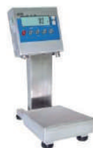
WPT 3H1 Versione con colonna