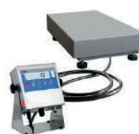
WPT 3H1/K Versione con colonna