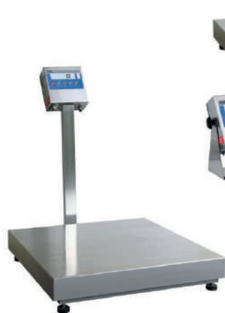
WPT H Versione con colonna